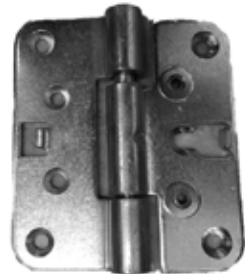
5248 KS ZN